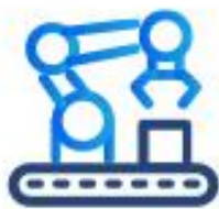
建築工程及機 電維修